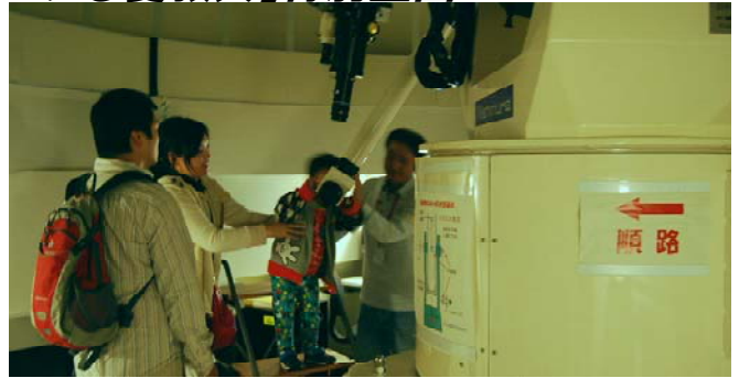
前回(第96回)の観望会の様子

工作(第一共通棟108室)・星座物語(同201室) 講座(自然科学棟5階538室)・3D(同574室) 観望会(自然科学棟屋上・天文台)